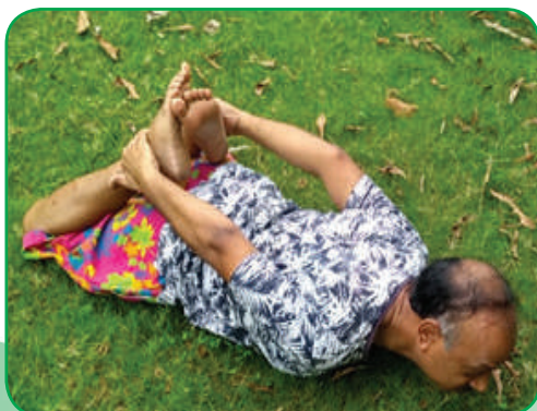
ITI Naini Plant