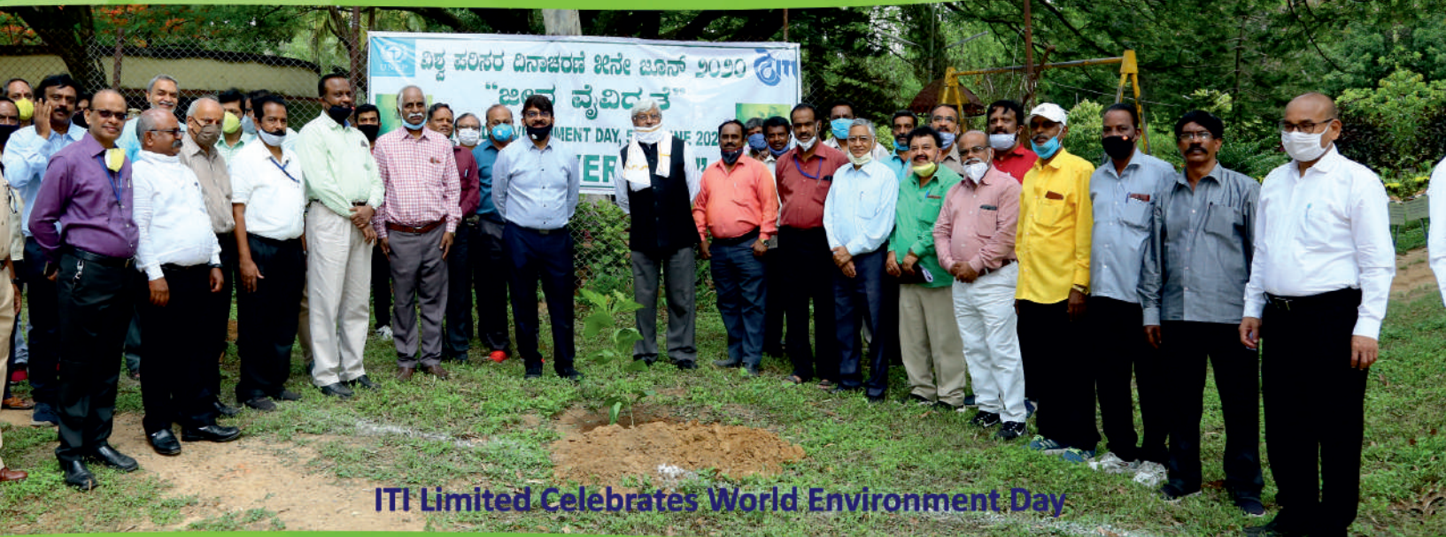
ITI Limited Celebrates World Environment Day