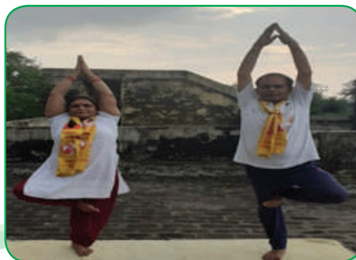
ITI Mankapur Plant